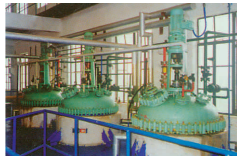
产品在中国科学院上海有机化学研究所开发公司使用 The product be used in the China Science Research Institute Shanghai organic chemical company.