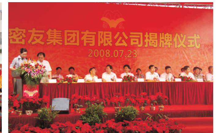
2008年7月23日密友集团有限公司揭牌 July 23rd, 2008, Miyou Group Founded