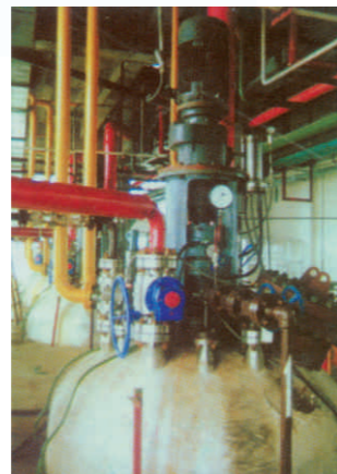
产品在升华拜克生物化工有限公司使用 The product be used in Shenghua Biok Biological Chemical Company.