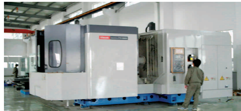
日本山崎马扎克公司的卧式加工中心 Japan MAZAK horizontal process center