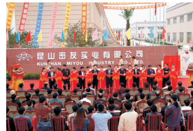
2003年10月18日密友迁入新厂区 Miyou moved into new plant on Oct.18,2003