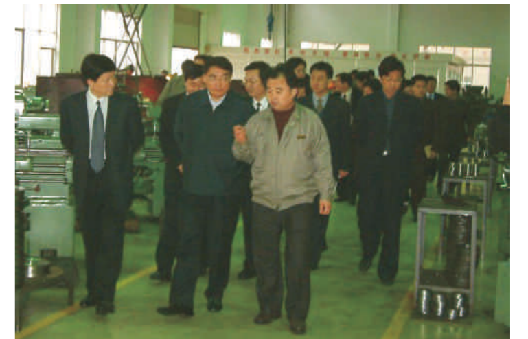
中共第十七届中央委员会委员、 吉林省省委书记王珉同志来我公司视察 Wang Ming-the former Jilin Province secretariat came to our factory for inspection.