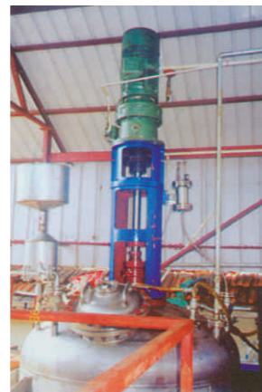
产品在台湾台联精细化工有限公司使用 The product be used in Taiwan Tallian fine chemicals company.