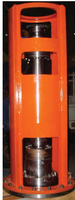
为大震锅炉生产的搅拌 密封传动装置 The Agitator Drive transmission device for TAIJUNE BOILER company