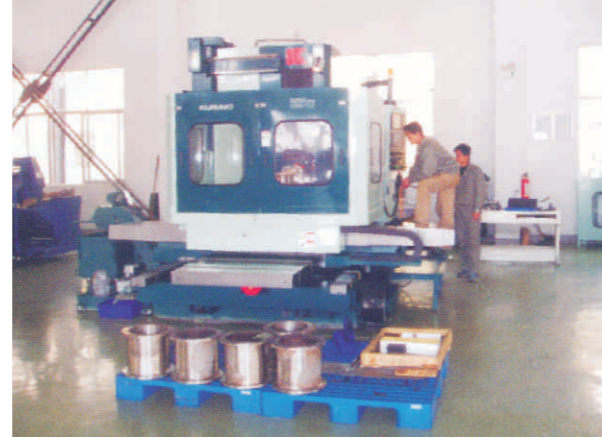
仓敷机械株式会社的数控铣床 Japan KURAKI CNC milling machine