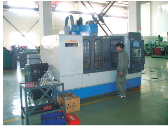
日本小巨人机床有限公司的立式加工中心 Japan LGMazak vertical process center