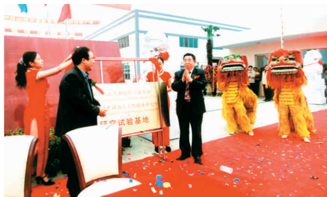
中华人民共和国科学技术部国家非金属矿深加工工程技术研究中心研究实验工地揭牌仪式 Unveiling Ceremony for National Engineering Research Center for Further Processing of Non-metallic Minerals, the Ministry of Science and Technology, the People's Republic of China