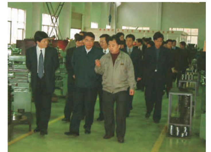
中共第十七届中央委员会委员、吉林省省委书记王珉同志来我公司视察