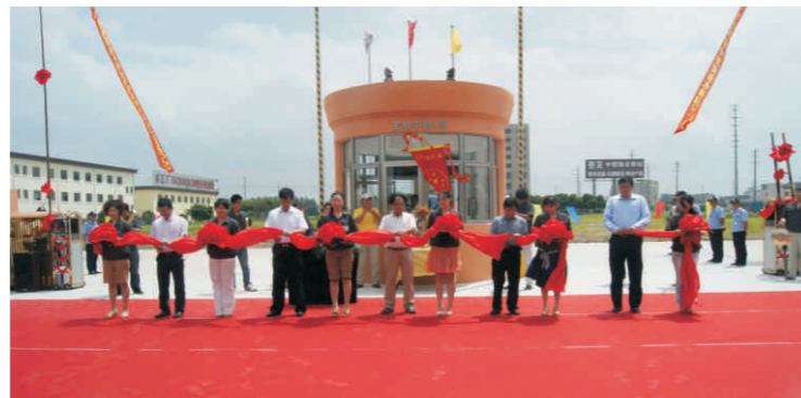
2012年8月3日密友集团开新大门! New Gate relocate ceremony on Aug.3th, 2012