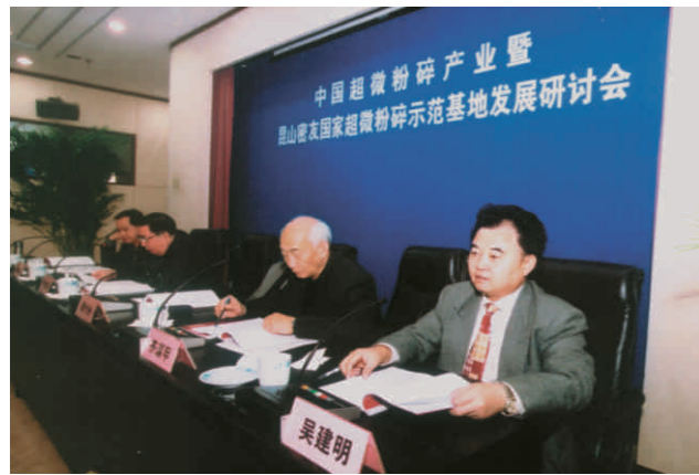
中国超微粉碎行业暨昆山密友国家超微粉碎示范基地发展研讨会在北京国际会议中心举行