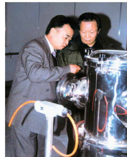
原中国石油和化学工业协会会长谭竹州先生来我公司参观指导