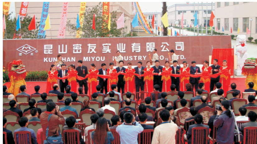
2003年10月18日密友迁入新址 Miyou moved into new plant on Oct.18, 2003